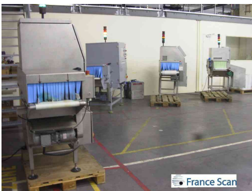
Machines automatiques ( à mettre sur ligne ou utilisables en mode manuel )

Nous disposons également des équipements nécessaires pour le reconditionnement et la repalettisation des produits ( préparateurs de commandes, banderoleuse, fardeleuse, pistolets à colle .... )