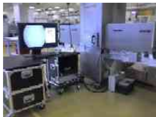
Intensifier Mobile Sapphire Alliance 70kV

Toutes les installations/mises en œuvre de machines Rayons-X en location sont suivies et supervisées par un PCR certifié ( Personne Compétente en Radioprotection )